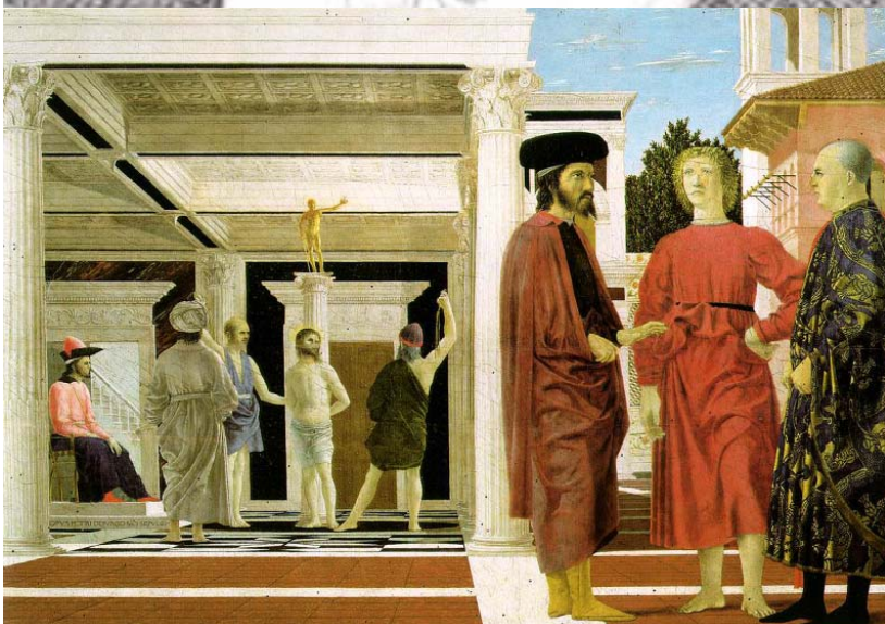
Piero DELLA FRANCESCA, La Flagellation 1470. Tempera sur bois. 58.4 × 81.5 cm